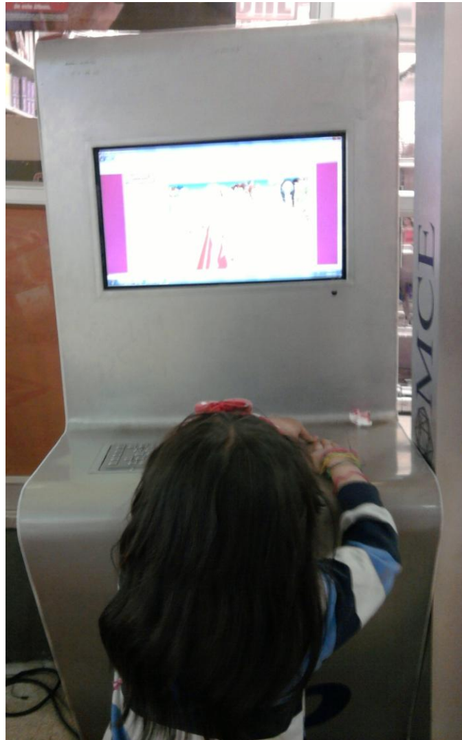
Niña jugando / aprendiendo en un computador público de un centro comercial.

Qué pasaría si los niños / estudiantes tuvieran la posibilidad de decidir sobre lo que quieren aprender y cómo quieren aprenderlo? La escuela no se ha dado cuenta que ya lo están haciendo: véase el Aprendizaje Invisible. 32